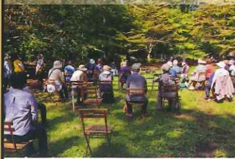
青空体操@小宮公園