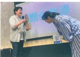
退任役員をねぎらいました