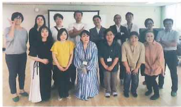
専門役員の皆さま