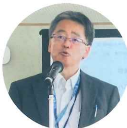
上田校長会会長挨拶