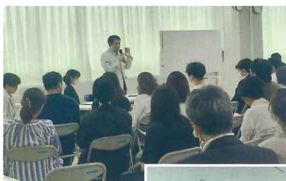
市長とのトークイベントにて

ある「給食費無償化について」「学校施設の空調設備について」「学校での防災備蓄品について」「部活動の地域移行について」の4つについて、市長自らご説明をいただきました。どのテーマについてもしっかりとした根拠を基にわかりやすく説明頂き、とても有意義な時間を過ごすことができました。中P連では「市長懇談会」も事業の1つとなっています。今後このような機会を通じて保護者の声を届けていこうと思えます。