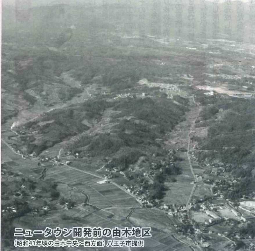
ニュータウン開発前の由木地区 (昭和41年頃の由木中央～西方面)