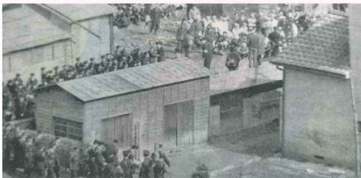
村議会で議決するときに警察隊が240名も出動した

昭和29年(1954)、東京都知事は町村合併促進法に基づく合併計画案として、由木村と多摩村の合併を諮問しました。由木村では、日野町・七生村・稲城村・由木村・多摩村の東部5ヶ村の合併を希望し