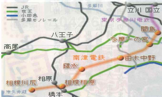
サイト「南津鉄道の光と影」 https://hkuma.com/rail/nanshin/nanshin00.html より引用

大正12年関東大震災の後、当時は私鉄設立のブームであり、建設中の玉南電鉄の関戸駅（現在の京王聖蹟桜ヶ丘駅）に接続する多摩一の宮駅を設けそこを起点として、現在の由木街道沿いである由木中野〜鎌水〜相模原を経由して津久井の川尻までを結ぶ鉄道の敷 設計画が大正15年に認可されました。本社を鎌水に置き株券を販売して昭和4年に入り数か所で工事に着手しましたが、その年の暮れに世界恐慌で生糸相場が60%も値下がり株券が売れず鎌水絹商人の豪商も没落、昭和5年3月ついに計画が挫折してしまいました。もし南津電気が