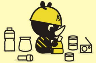
東京防災公式キャラクター 「防サイくん」

備蓄品の種類や量は、家庭構成や家族状況によって異なります。まずは3日分、できれば1週間分を目標に備蓄を進め、災害に備えましょう。